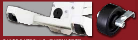
※シングルタイプのキャスターは別売品となります。

4 キャスター移動 ツイントリプルタイプはキャスター標準装備。取っ手を持ち楽に移動できます。